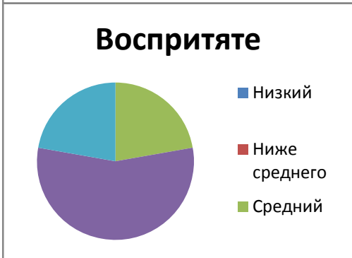
Начало 2016-2017 учебного года.