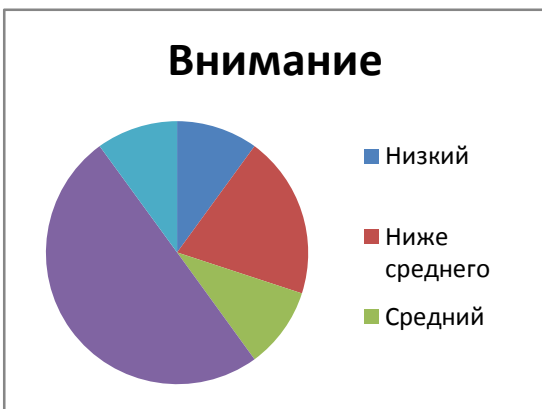
Начало 2016-2017 учебного года.