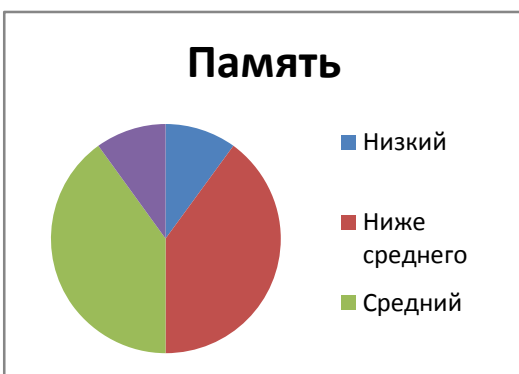
Начало 2016-2017 учебного года.