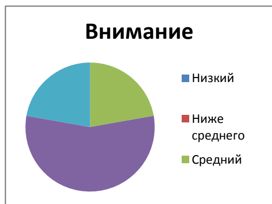
Конец 2016-2017 учебного года